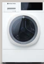
Stellaria Snow AAA0.100