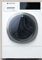
Serenity Snow AAA1.101